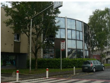
La Médiathèque Jean Pierre Besse

Inauguration des fresques de l'espace Matisse, Square Rodin, du Centre de ressource de la mémoire partagée et du local dédié à l'AMOI le 13 septembre en présence d'une trentaine de personnes et journée portes ouvertes le 15 septembre (5 personnes de l'AMOI se sont relayées toute la journée pour accueillir un public qui n'est pas venu).